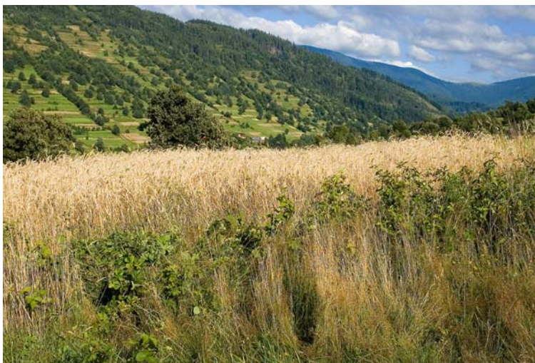
Widok na Abrahamów ze stoków Prusowa

Abramów (1084 m) - kulminacja w krótkim, bocznym grzbiecie odchodzącym na północ od pasma granicznego w rejonie Jaworzyny (1173 m). Na szczycie charakterystyczny "grzebień" boru świerkowego. Pomiędzy wierzchołkiem a graniczną Jaworzyną znajduje się łagodne siodło z widokową halą, przez którą przechodzi szlak turystyczny. Zalesione