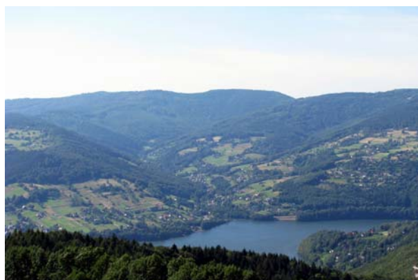
Widok na Beskid Mały z Żaru

Żar (761 m) - długa polana ciągnąca się w kierunku wschodnim na zbocza Kiczery (831 m), powstała w okresie przemieszczania się ludów pasterskich (m.in. pochodzenia wołoskiego) szczytami Karpat. Polana obecnie, pomimo intensywnego zagospodarowania turystyczno-narciarskiego, posiada wybitne walory krajobrazowe w skali powiatu żywieckiego, z szeroką gamą panoram widokowych w każdym kierunku.