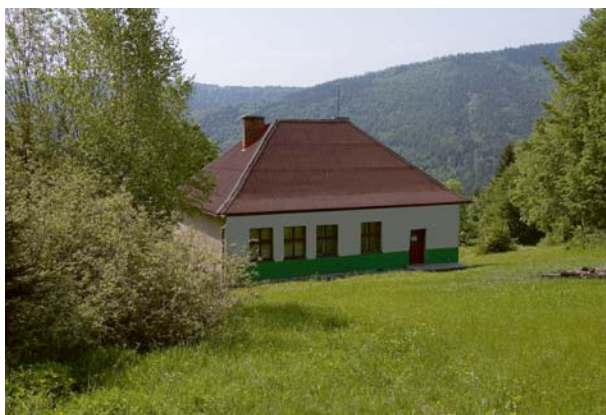
Schronisko PTSM Sól-Oźna

Oźna (952 m) - kulminacja w równoleżnikowym grzbiecie bocznym, odchodzącym na wschód od Beskidu Wrzeszcz. Kopała szczytowa jest wydłużona i stosunkowo płaska, częściowo zalesiona i pokryta polami uprawnymi, łąkami i zagajnikami. Od strony południowej pod grzbiet podchodzą rozrzucone zabudowania przysiółka Oźna.