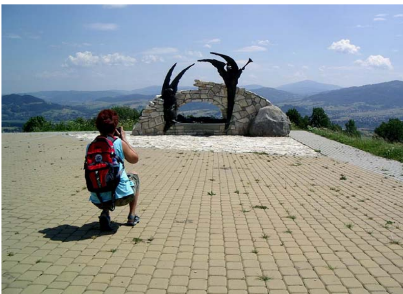
Golgota Beskidów na Matysce

Ochodzita (895 m) - wyrazista, bezleśna góra o kopulastym kształcie, wznosząca się w głównym grzbiecie karpackim, częściowo na terenie powiatu cieszyńskiego. Zbudowana jest z gruboławicowych, gruboziarnistych, wapnistych piaskowców krośnieńskich, znacznie odporniejszych na wietrze niż otaczające ją skały, tworzące obniżenie Bramy Koniakowskiej. To zdecydowało zapewne o nazwie góry, czyli fakt, iż wędrowca idącego z którejkolwiek strony ukształtowanie terenu zmusza do obchodzenia szczytu. Ze szczytu Ochodzitej roztacza się jedna z najpiękniejszych i najpełniejszych panoram górskich w całym Beskidzie Zachodnim.