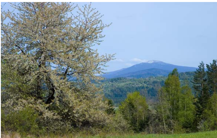
Widok na Pilsko z Przełęczy u Poloka

U Poloka - przełęcz stanowiąca dział wodny pomiędzy dolinami: Juszczyнки i Sopotni Małej, a także obejmująca najwyższe położone osiedle Juszczyzny, podchodzące pod przełęcz od zachodu. To szerokie, bezleśne siodło oddziela kulminacje Jastrzębicy od Waligórki w grzbiecie Juszczyнки i prezentuje liczne panoramy widokowe. Prowadzi tędy stara droga z Juszczyzny do Sopotni Małej, łącząca również dolinę Soły z rejonem Jeleśni i Korbielowa.