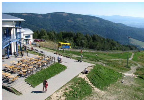
Obiekty turystyczne na górze Żar