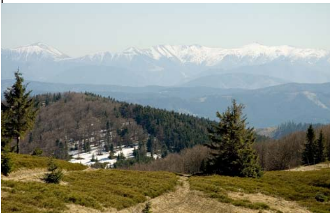
Panorama Tatr z Wielkiej Raczy

Wielka Racza (1236 m) - według podań spisanych przez Komonieckiego nazwa pochodzi od słowa