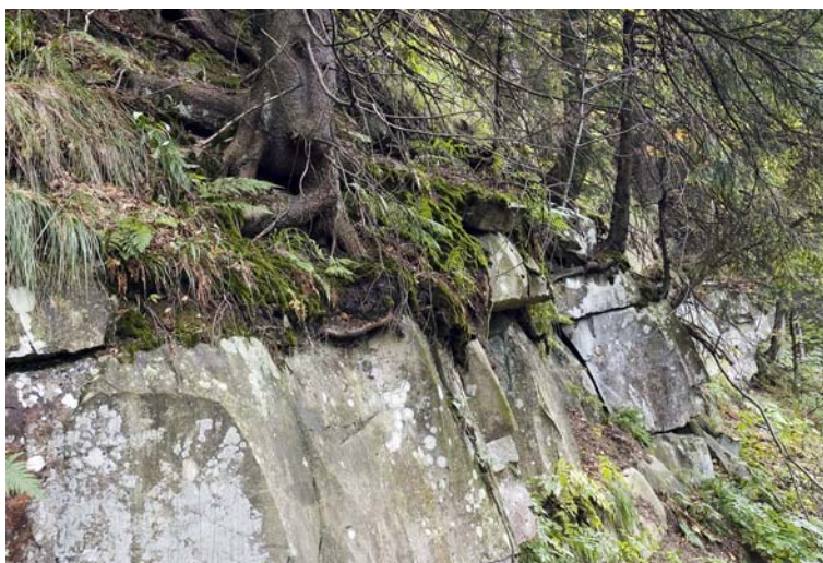
Osuwisko na Lipowskiej

pstrych, będących dla tego piaskowca warstwą poślizgową. Zachodnie stoki Skałki tworzą misę o bardzo stromych zboczach, gdzie w górnej części znajdują się skałki i ambony o wysokości do 5m. Na grzbiecie ramienia występuje również bardzo dobrze wykształcony, skalisty rów grzbietowy o długości około 200 m, gdzie w jednej z jego ścian znajduje się otwór jaskini szczelinowej. Podobna jaskinia pochodzenia osuwiskowego powstała w gruboławicowych piaskowcach