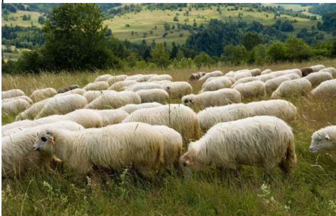
Wypas owiec w Beskidach

Jałowiec (1111 m) - najwyższy i centralnie położony szczyt Pasma Jałowieckiego. Pod Jałowcem znajdują się źródła Koszarawy, Stryszawki i Welczówki, a na jego południowym zboczu położona jest