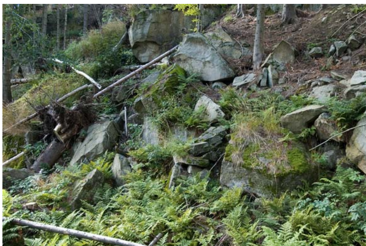
Osuwisko w rezerwacie „Kuźnie”

początek na stokach gór w tzw. części źródłiskowej. Źródła występujące tutaj, są najczęściej zstępujące, a woda wydostaje się z poziomego wodonośnego w punkcie przecięcia z powierzchnią terenu dzięki sile grawitacji. Zjawiska takie obserwowane są na wszystkich opisanych szlakach, a w szczególności - w rejonie Romanki oraz w szczytowej części pasma Lipowskiej. Z innych rodzajów źródeł wymienić należy jeszcze: przelewowe, uwidaczniające się po większych opadach