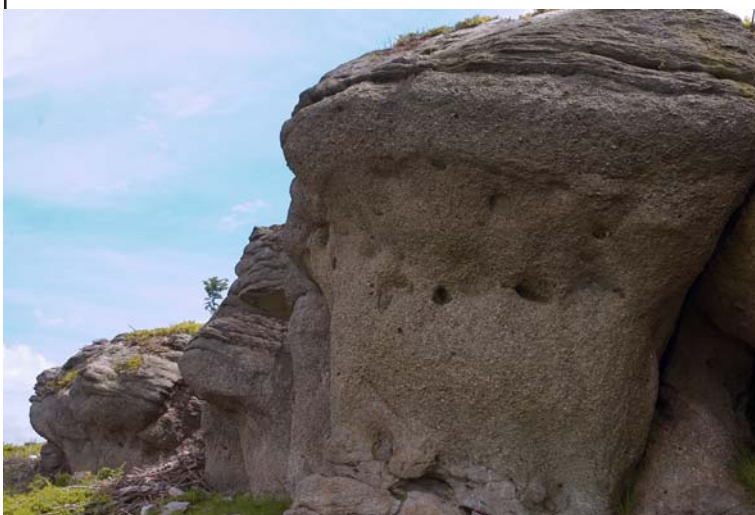
Wychodnie skalne w Beskidzie Śląskim

Karolówka (931 m) - mało wyrazisty, całkowicie zalesiony szczyt w głównym wododziale Polski, na granicy Wisły, Istebnej i Kamesznicy. Jest ważnym punktem zwornikowym, gdyż grzbiet Beskidu Śląskiego rozdziela się tutaj na dwa główne pasma: Stożka i Czantorii oraz Baraniej Góry.