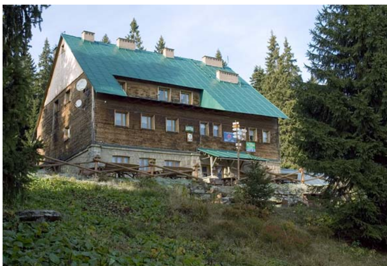
Schronisko PTTK na Hali Lipowskiej

Lipowska (1324 m) - należy do najwyższych szczytów w tej części Beskidu Żywieckiego i razem z sąsiednią Rysianką (1366 m) tworzy jedno z trzech głównych "gniazd" górskich, tak charakterystycznych dla tego regionu. Mało wyrazisty wierzchołek, pokryty górnoregłowym borem świerkowym, ma charakter ułożonej równoleżnikowo grzędy. Z Hali Lipowskiej roztacza się panorama na grzbiet graniczny Grubej Buczyny i Krawcowego Wierchu, oddzielony doliną Bystrej oraz