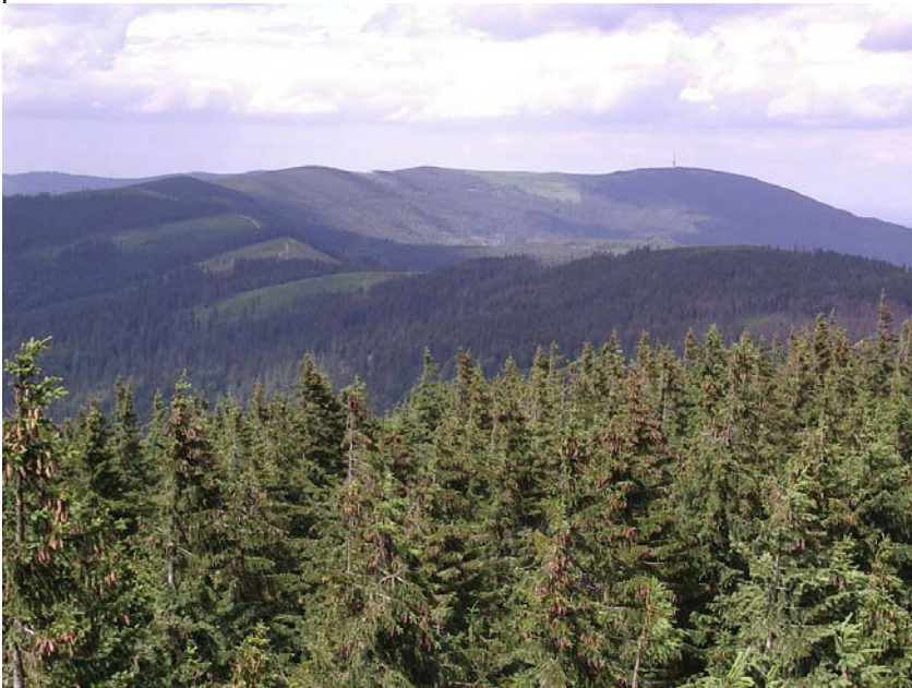
Widok na Skrzyczne z wieży na Baraniej Górze

Skrzyczne (1257 m) - najwyższy szczyt Beskidu Śląskiego, wznoszący się na północnym krańcu wyraźnie zrównanego Pasma Baraniej Góry, w bocznym grzbiecie Beskidu Śląskiego. W stronę doliny