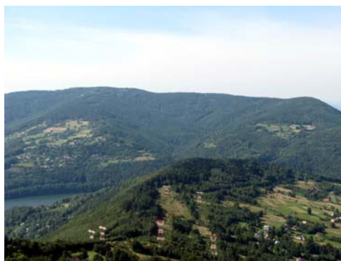
Witok w kierunku Hrobaczej Łąki z Żaru

Hrobacza Łąka (830 m) - znajduje się pomiędzy szczytami: Groniczki i Bujakowski Groń. Stanowi niezwykle atrakcyjny punkt widokowy - wspaniale stąd prezentują się zwłaszcza okolice Jeziora Międzybrodzkiego. Nieopodal znajduje się potężna stalowa konstrukcja krzyża, wzniesiona na pamiątkę 2000 lat chrześcijaństwa - z platformą widokową, z której można oglądać okolice Bielska-Białej. Poniżej szczytu znajduje się prywatne schronisko.