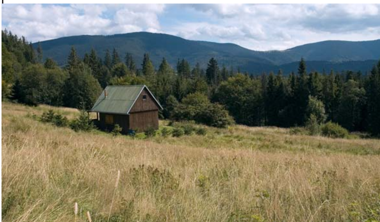
Widok na Przełęcz Pawlusią

jąca się w grzbiecie odchodzącym na północ od Pilska, rozdzielającym doliny Sopotni Wielkiej i Kamiennej. Przełęcz stanowi wyraźne wcięcie pomiędzy ostro opadającą kulminacją Łabysówki